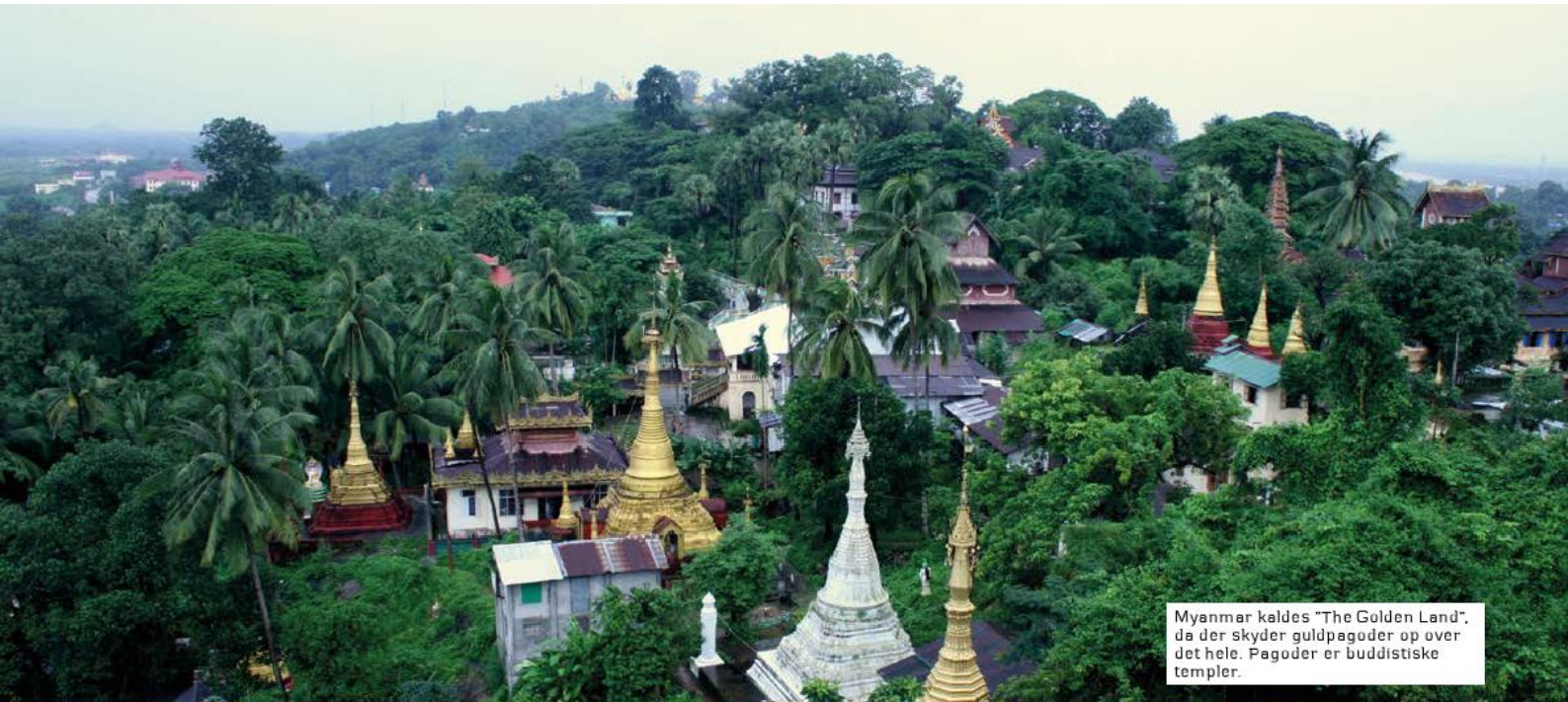
Myanmar kaldes "The Golden Land", da der skyder guldpagoder op over det hele. Pagoder er buddistiske templer.