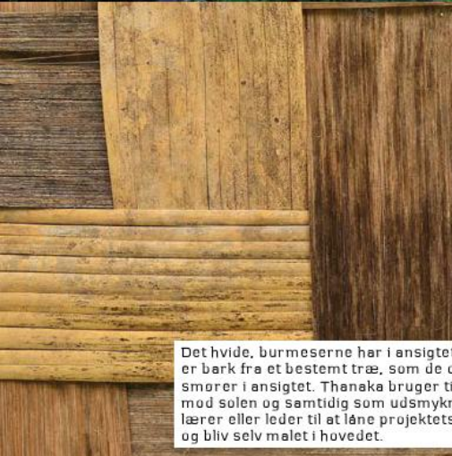
Det hvide, burmeserne har i ansigtet, er thanaka. Det er bark fra et bestemt træ, som de opløder i vand og smører i ansigtet. Thanaka bruger til at beskytte sig mod solen og samtidig som udsmykning. Spørg din lærer eller leder til at låne projektets aktivitetskasse og bliv selv malet i hovedet.