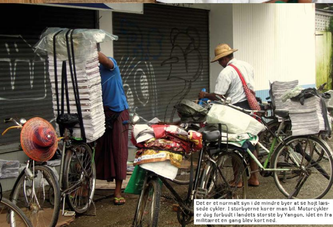
Det er et normalt syn i de mindre byer at se højt læsede cykler. I storbyerne kører man bil. Motorcykler er dog forbudt i landets største by Yangon, idet en fra militæret en gang blev kørt ned.